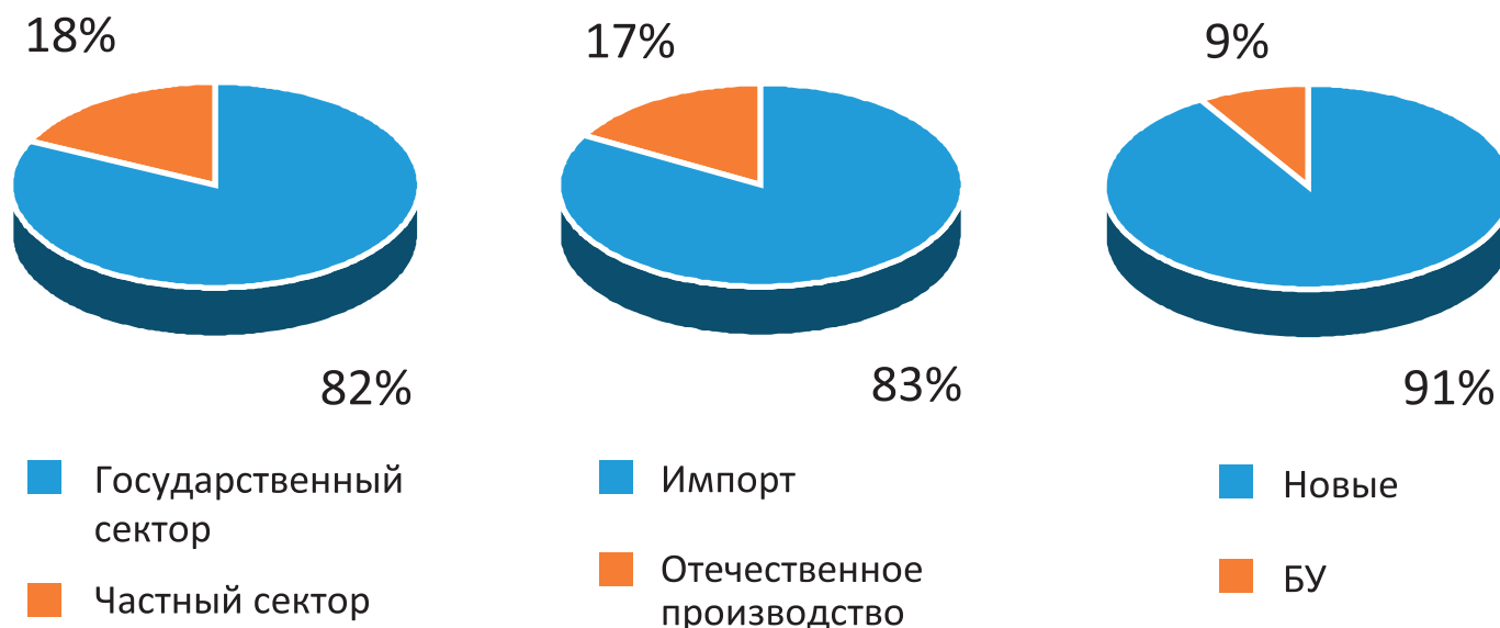
Рисунок 2. Сегментация рынка медицинских изделий России в 2013 году

Пожалуй, наиболее обсуждаемым в средствах массовой информации стал проект Постановления Правительства РФ «Об установлении